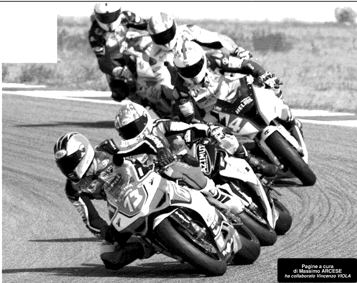
Pagine a cura di Massimo ARCESE ha collaborato Vincenzo VIOLA