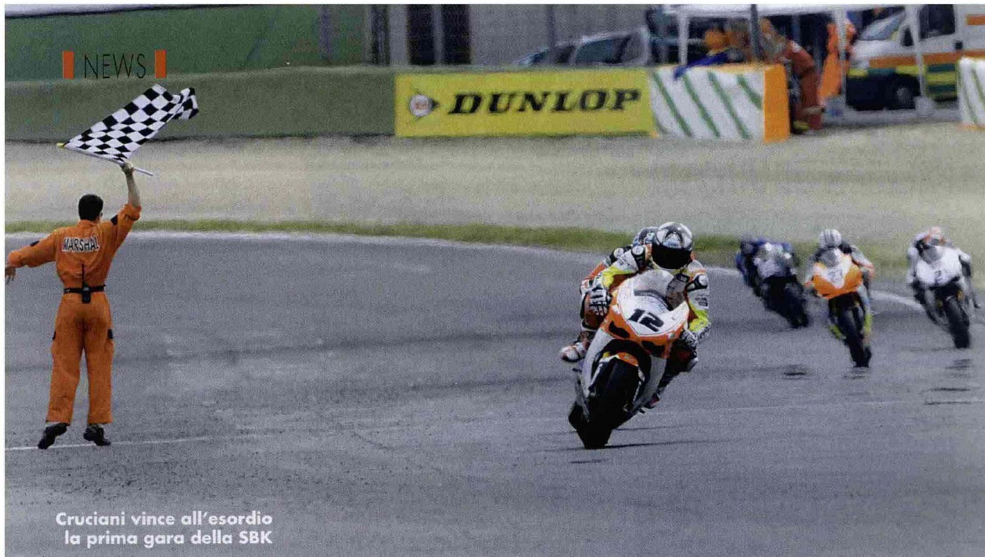
Cruciani vince all'esordio la prima gara della SBK