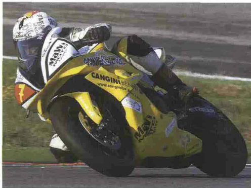
A Beatrice Bossini è intitolato il trofeo Esordienti che si disputerà in prova unica il 27 Giugno a Magione.

Trofeo Bossini e a € 100,00 per il Campionato Italiano, per il quale è previsto un montepremi in denaro di € 2.000 per le prime tre classificate in entrambe le categorie (600 e 1000). Infine le più importanti industrie di pneumatici hanno deciso di supportare sia il Campionato Italiano che il Trofeo Bossini, proponendo diversi Challenge monomarca, con in palio premi in materiale. Bridgestone, Continental, Dunlop, Metzeler, Michelin e Pirelli, hanno già aderito all'iniziativa.