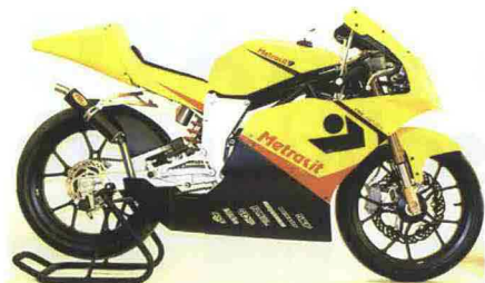
La Mini GP (sopra) e la Pre-GP, due tipologie di moto adatte alla crescita agonistica dei giovani piloti. FMI organizza direttamente il Campionato Italiano Mini GP, mentre il Trofeo Italia Pre-GP è sotto l'egida della Metrafit Italia.